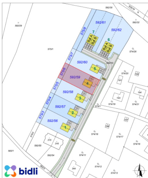
DP Záryby - stavební pozemek č. 4

Stavební pozemek s vydaným SPOLEČNÝM STAVEBNÍM POVOLENÍM Katastrální území: Záryby [791016] Parcelní číslo: 592/59 a 575/6 Výměra pozemku: 933 m 2