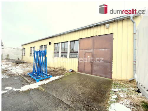
Pronájem výrobní/skladovací haly o celkové ploše 432m 2 , Třeboň (orientační plánek)