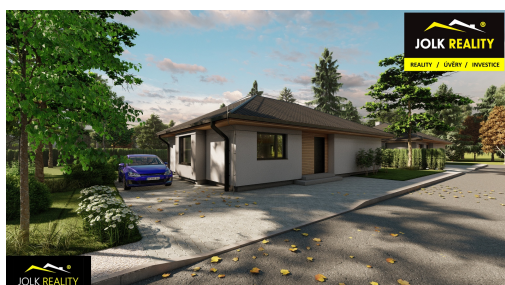
Výstavba rodinného domu dispozice 5+KK / podlahová plocha 127 m 2