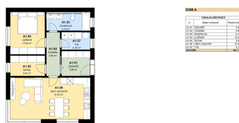
Přílohy 1 NP 1/75