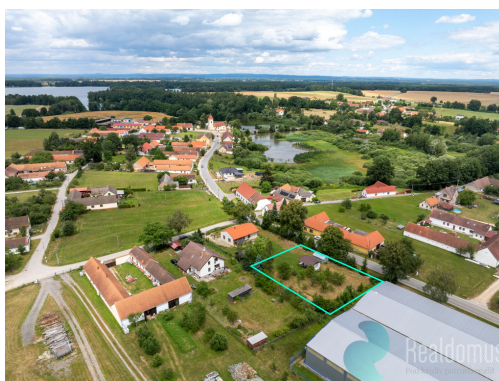
Územní plán, k.ú. Dolní Slověnice