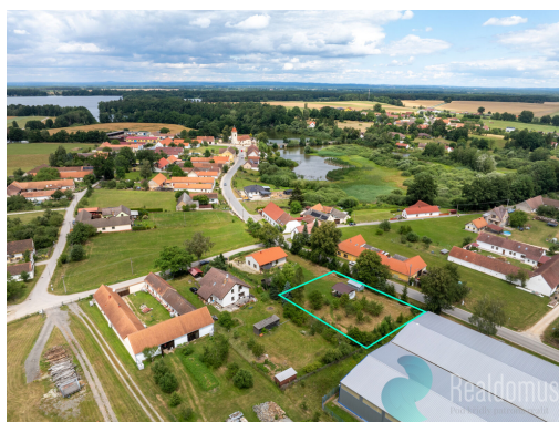
Územní plán, k.ú. Dolní Slověnice