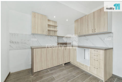
Byt.č.4 - 1.patro