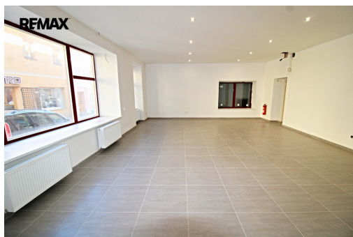
STELNÍ 123, Kaplice Legenda PŘÍZEMÍ