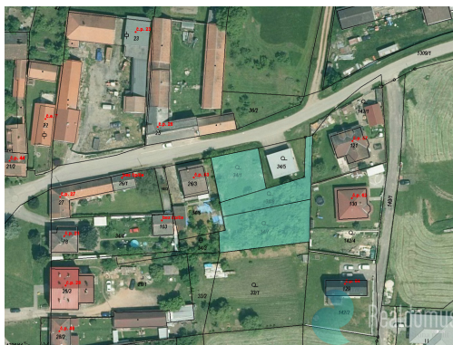
Územní plán, k.ú. Radošovice u Českých Budějovic