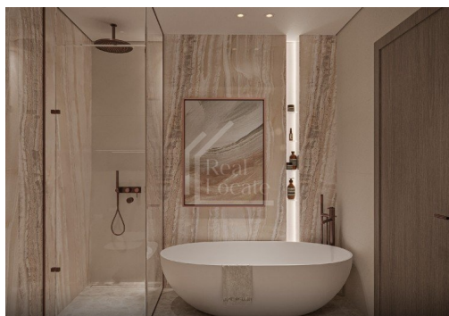
1BHK - TYPICAL