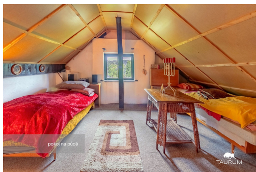
pokoje na půdě