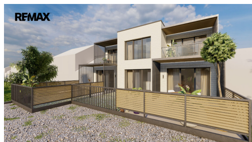
Bytová jednotka 3.C

Obřanská, Brno-Maloměřice a Obřany, Brno