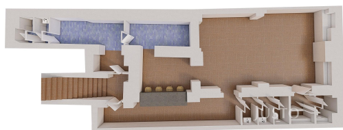
Suterén - přední část - RESTAURACE