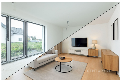
Zámecké rezidence Škvorec

Byt 4+kk (131,5 m 2 ) se zahradou (349,5 m 2 ), přízemí