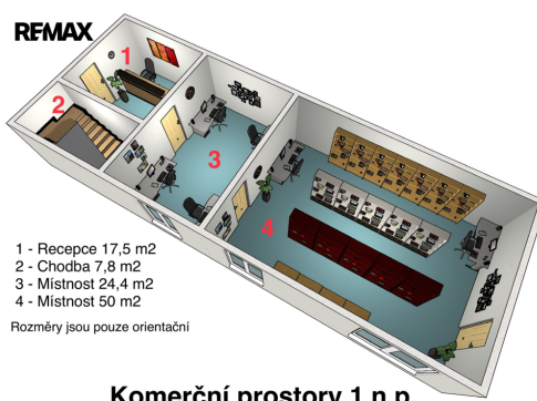
Komerční prostory 1 n.p.