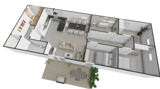
REMAX Půdorys – 1NP