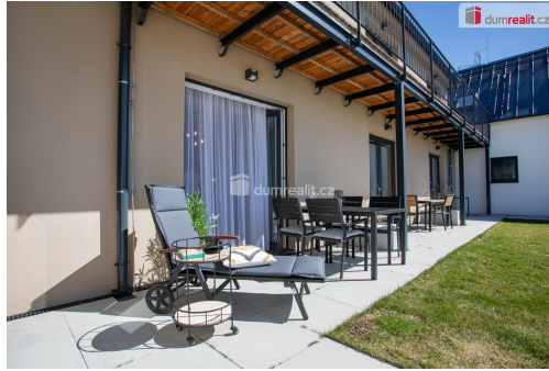
K prodeji, apartmán/byt 1+kk s terasou, v osobním vlastnictví, Kovářov-Frymburk, u vodní nádrže Lipno (orientační plánec)