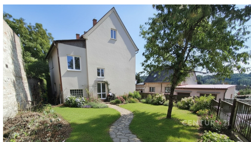
Kladno - rodinný dům 5+1 (200 m 2 ) se zahradou (195 m 2 ) a garáží, podkroví