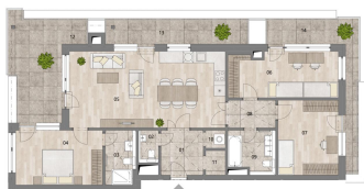
Nové Chabry / etapa H / budova B oblast: Chabry 1