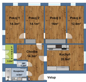
Bytová jednotka 4+1 s lodžii *Plánka a výměry jednotlivých místností jsou jen orientační.