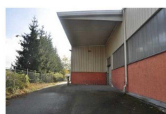
Výrobní a skladové haly č.p. 8 na pozemku parc. č. st. 108