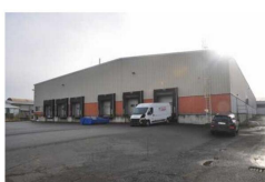
Výrobní a skladové haly č.p. 8 na pozemku parc. č. st. 108