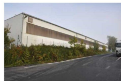
Výrobní a skladové haly č.p. 8 na pozemku parc. č. st. 108