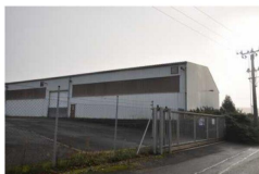
Výrobní a skladové haly č.p. 8 na pozemku parc. č. st. 108