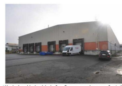
Výrobní a skladové haly č.p. 8 na pozemku parc. č. st. 108