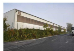
Výrobní a skladové haly č.p. 8 na pozemku parc. č. st. 108