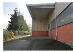
Výrobní a skladové haly č.p. 8 na pozemku parc. č. st. 108