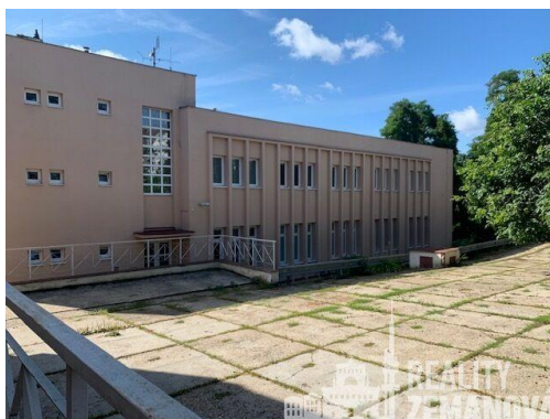
2.NP, U Zásobní zahrady 2552/1, Praha 3