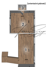
K prodeji, byt 6kk, v osobním vlastnictví, ul. Matice školské 195/8 České Budějovice