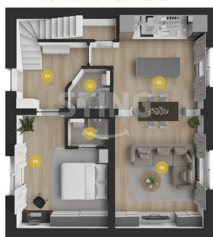
RODINNÝ DŮM 1.NP