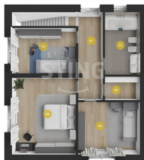
RODINNÝ DŮM 2.NP