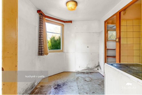
kuchyně v patře