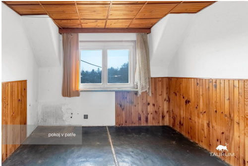
pokoj v patře