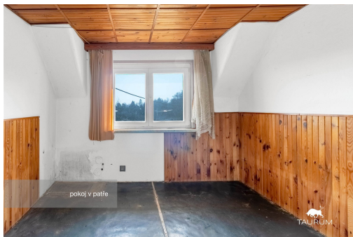
pokoj v patře