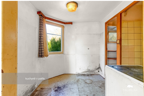
kuchyně v patře