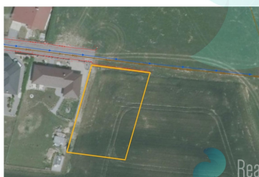
Výkres inženýrských sítí