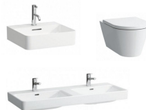
Premiová sanita výrobce Laufen modely Val, Pro S, Karol