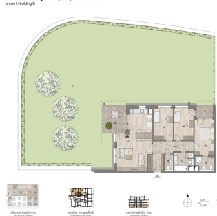
Nové Chabry / etapa I / budova G