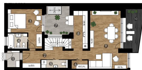
MEZONETOVÝ BYT - PŘÍZEMÍ