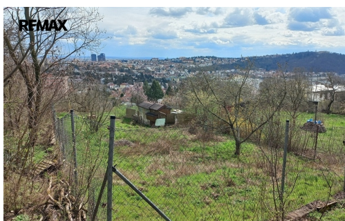
pohled na Brno přes sousední pozemek