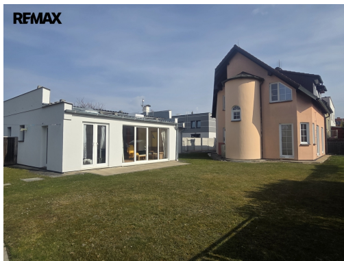
REMAX Prodej rodinného domu s dalším bytem, ul. Krumlovská, Rožnov