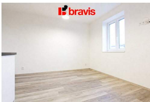
1+kk, ul. Tyršova, Brno, 22 m2