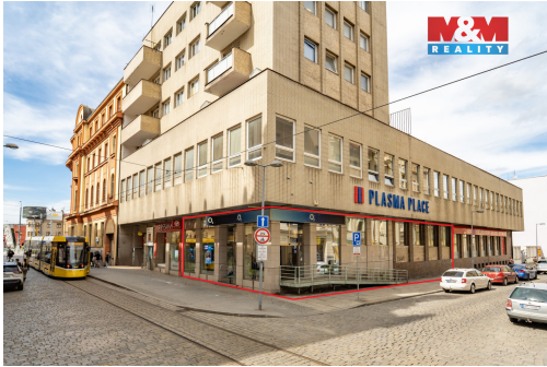
1.NP 182,41 m 2