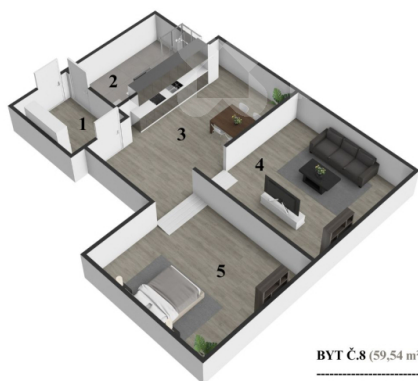
BYT Č.8 (59,54 m 2 )