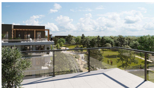
Nové Chabry / etapa I / budova H