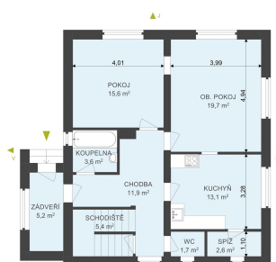
1.NP - RD, NERUDOVA, VE BRĚHÁCH