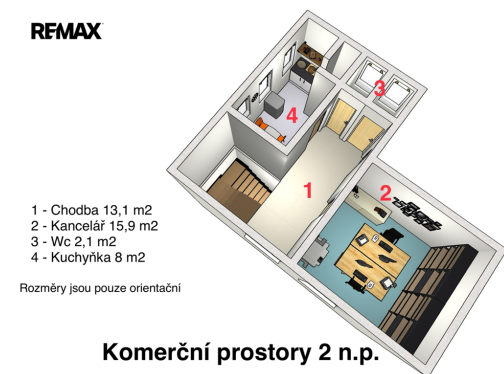
Komerční prostory 2 n.p.

Vyřizuje Petr Hořák Tel.: 730 163 554 GSM: +420723091990 E-mail: petr.horak@re-max.cz