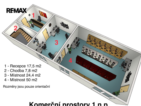
Komerční prostory 1 n.p.