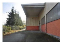
Výrobní a skladové haly č.p. 8 na pozemku parc. č. st. 108