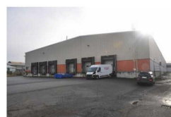
Výrobní a skladové haly č.p. 8 na pozemku parc. č. st. 108