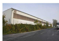
Výrobní a skladové haly č.p. 8 na pozemku parc. č. st. 108