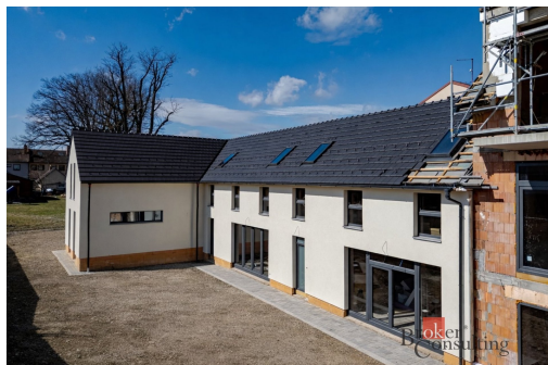
Rezidence Dubné Byt č. 3 3+kk (86,20 m 2 )

Výměra 1NF: O1 předsíň 5,40 m 2 O2 technická místnost 4,80 m 2 O3 lázeň 34,00 m 2 Celková plocha 44,20 m 2 O4 předzahrádka 19,70 m 2 Technická místnost pro výměnu vzduchu