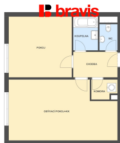
2+kk, Houbalova, Brno-Líšeň, 61,2 m 2