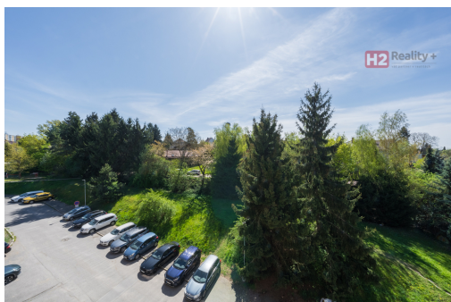
PRODEJ BYTU 2+kk, Říčany u Prahy - M. Pujmanové, 45 m 2