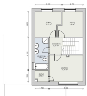
RODINNÝ DŮM A