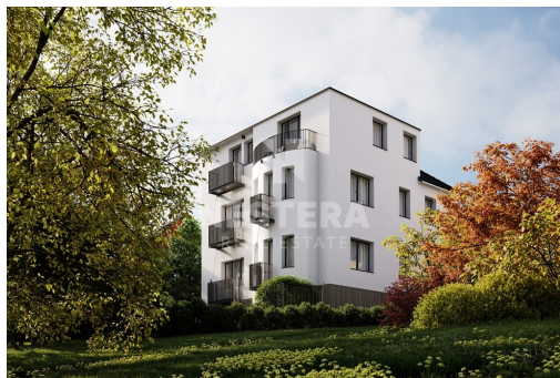
- REZIDENCE ŽELIVSKÁ - Bytová jednotka č. 8