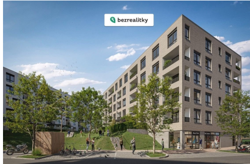
Residence U Šárky (Dům F2a) FNPF CZ s.r.o. IČ: 25201200 Tel: 800 200 306, info@bezrealitky.cz