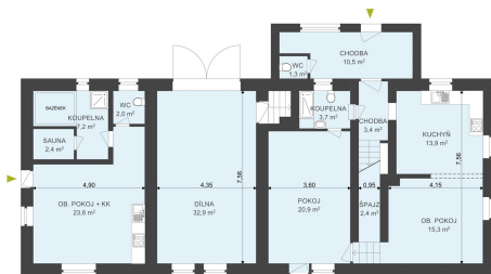
1.NP RD HŘIBSKO