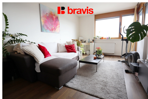
2+kk ul. Sochorova, Brno - Žabovřesky, 52 m 2