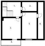
2. PATRO 1. Chodba 2. Kuchyně 3. Ložnice 4. Balkon 5. Pokoj 6. Úložný prostor