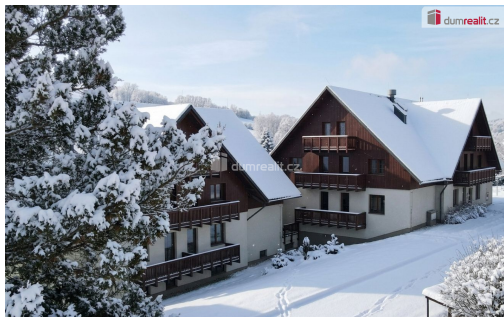
Byt 2+kk Rokytnice nad Jizerou