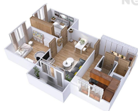
Prostorná 3+1 s balkonem, Zábřeh

*Plocha místností a umístění vybavení je pouze orientační