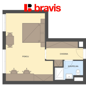
1+kk, Dornych, Brno-střed