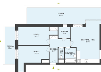
BYT 3+KK, SVOBODNÉ DVORY, HK